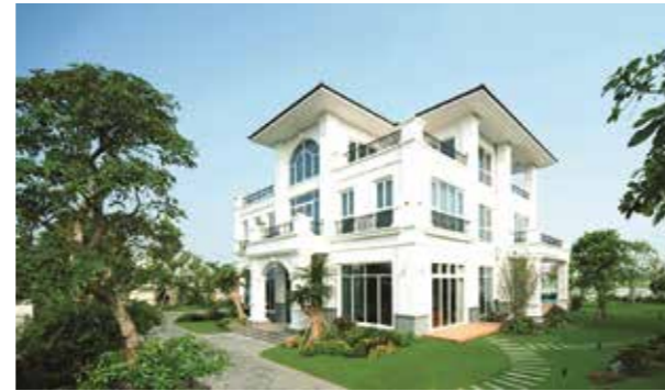
2 VILLA THẢO ĐIỀN QUẬN 2, TP.HCM