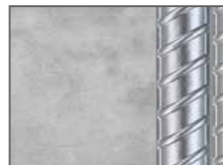
Được bảo vệ bởi Eco Đa Dụng