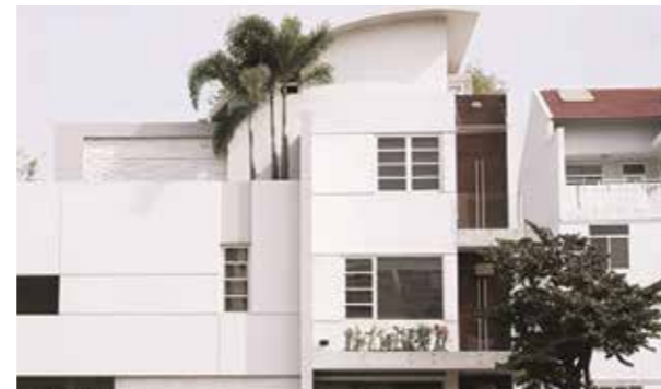
4 NHÀ PHỐ QUẬN 1, TP.HCM