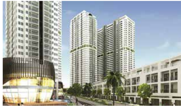
1 KHU CĂN HỘ EVERRICH QUẬN 11, TP.HCM