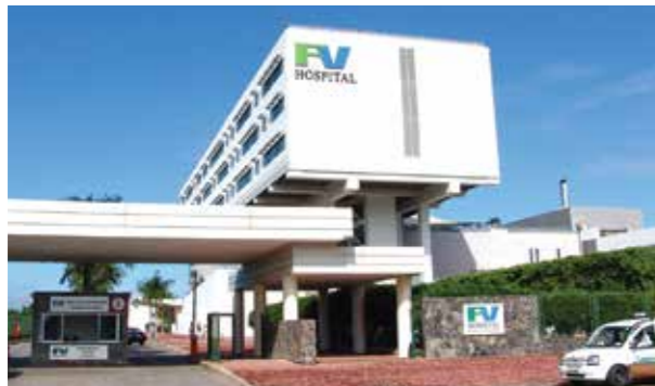
3 BỆNH VIỆN PHÁP VIỆT QUẬN 7, TP.HCM